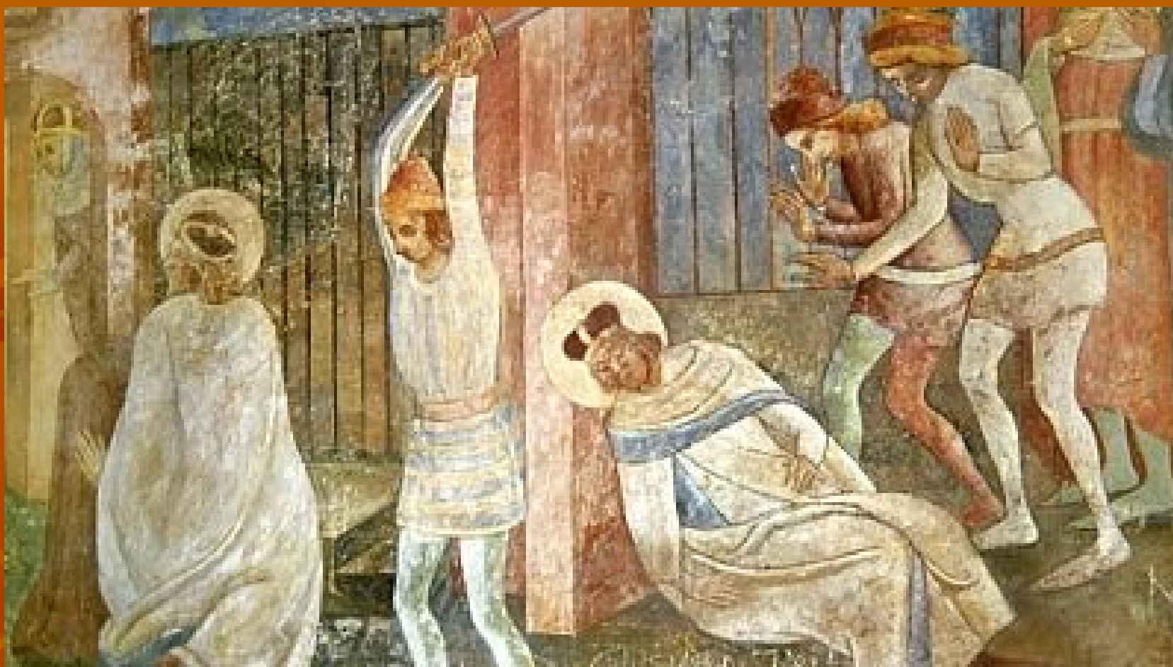
Malbana Karlštejně znázorňující svatéhoV áclava