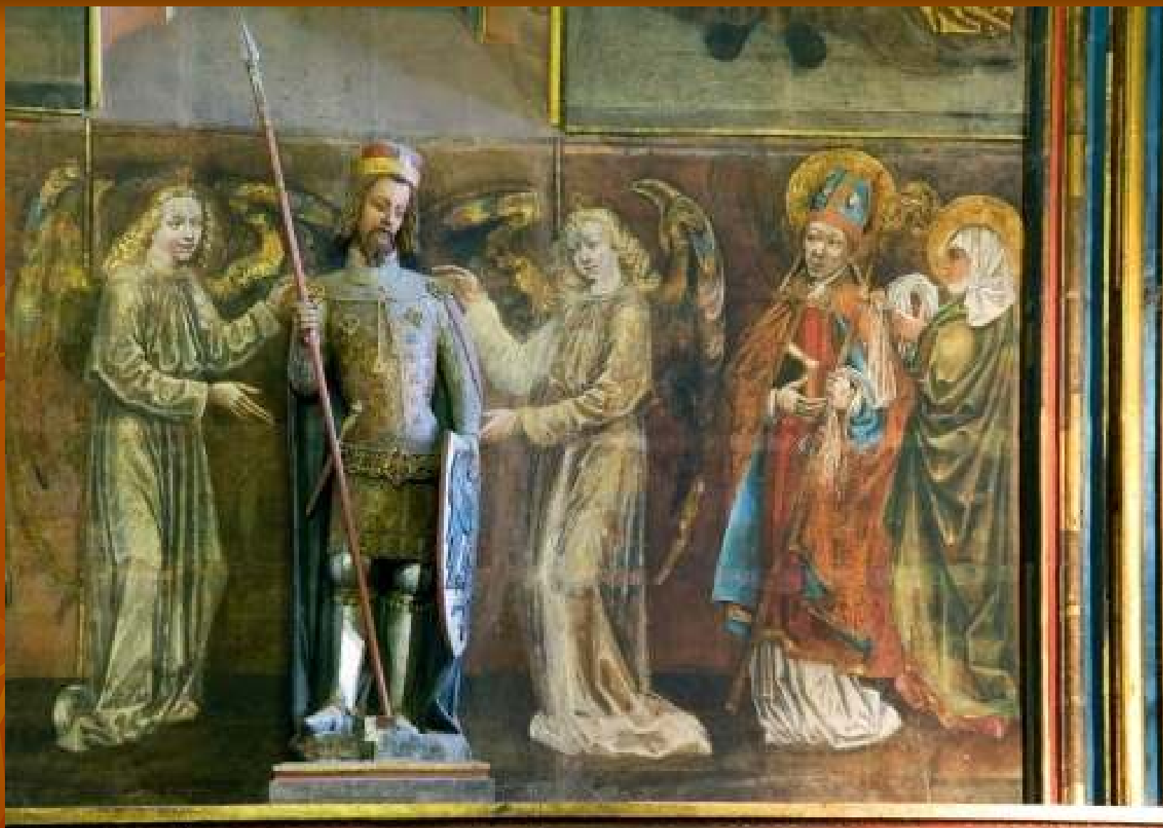
Socha sv. Václava ve Svatovítské katedrále na Pražském hradě